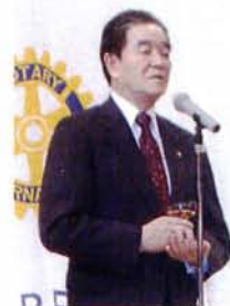
名誉会員の市長が乾杯