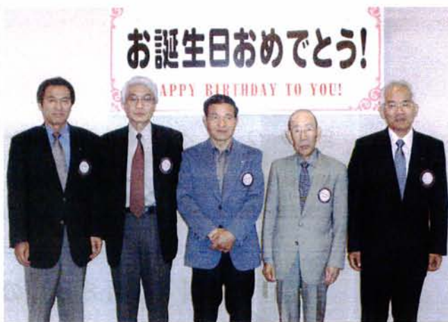
5月に誕生を迎えた会員たち