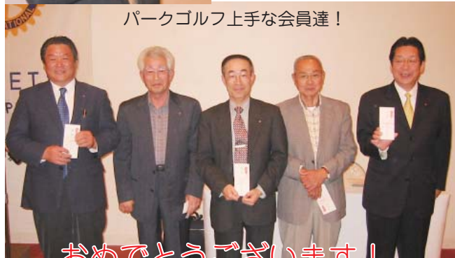
パークゴルフ上手な会員達！