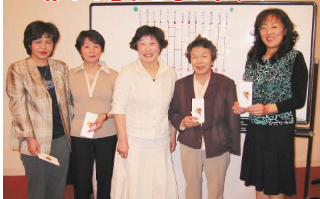
見事、ゲームで景品をゲットした奥様たち。