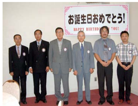
8月誕生を迎えた 会員の皆様