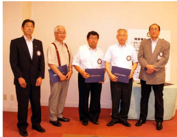
ポール・ハリス・フェローの認証を受けた会員たち