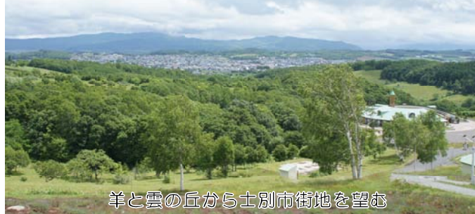
羊と雲の丘から士別市街地を望む