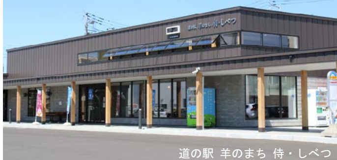
道の駅 羊のまち 侍・しべつ